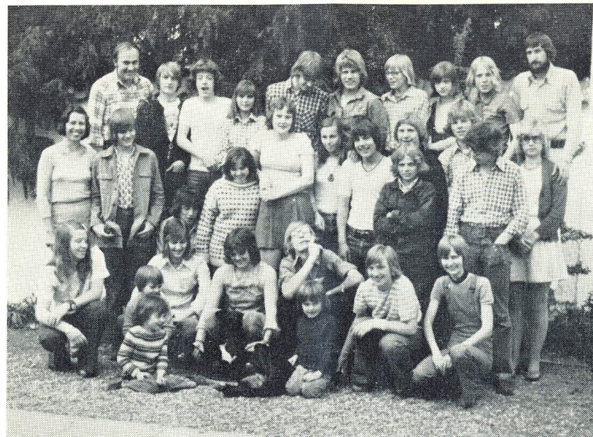
Med hilsen fra »Birkegården«s elever og lærere sommeren 1974

Det vil føre for vidt at referere om endags-ture og museumsbesøg, hvilke der har været mange af i årets løb.